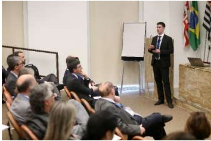
Alteração dos requisitos da FDA para testes de produtos extraíveis e lixiviáveis em sistemas de embalagens farmacêuticas – Changing FDA Requirements for Extractables & Leachables testing on Pharmaceutical Packaging Systems- Ministrante: Nelson Labs – Paulo Forte Apresentação