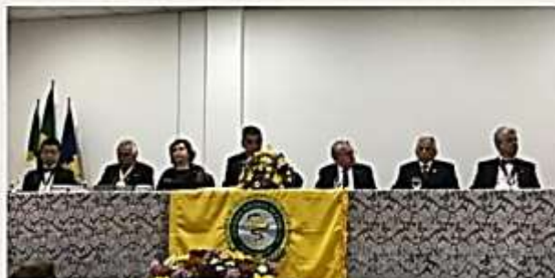
Mesa das Autoridades da Solenidade de Posse no Núcleo de Pesquisa e Desenvolvimento de Medicamentos da Universidade Federal do Ceará

No Brasil, grande parte dos medicamentos comercializados e consumidos é fabricada por poucos laboratórios nacionais ou multinacionais, evidenciando a característica de uma indústria farmacêutica oligopolizada. Esse oligopólio investe internacionalmente grandes somas em P&D e a concorrência se dá, sobretudo, pela diferenciação de produtos e não pelo preço. Os principais países inovadores no setor e que detêm as maiores fatias do mercado são os EUA, alguns países da Europa e o Japão.