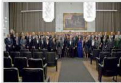
Homenageados na solenidade do 81º aniversário da ACFB/ANF.