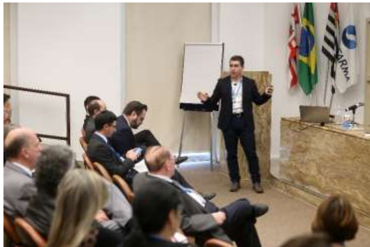
Soluções West em embalagens para injetáveis que contribuem para a segurança dos pacientes e simplificam processos na indústria farmacêutica. – 'West packaging solutions for injectables – contribution to patient safety and simplify processes in the pharmaceutical industry.– Ministrante: West – Deolinda Izumida Martins Apresentação