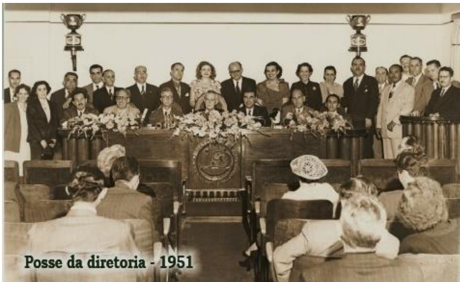
Posse da diretoria - 1951

Em 21 de abril de 2017 passa a ser denominada Academia de Ciências Farmacêuticas do Brasil.