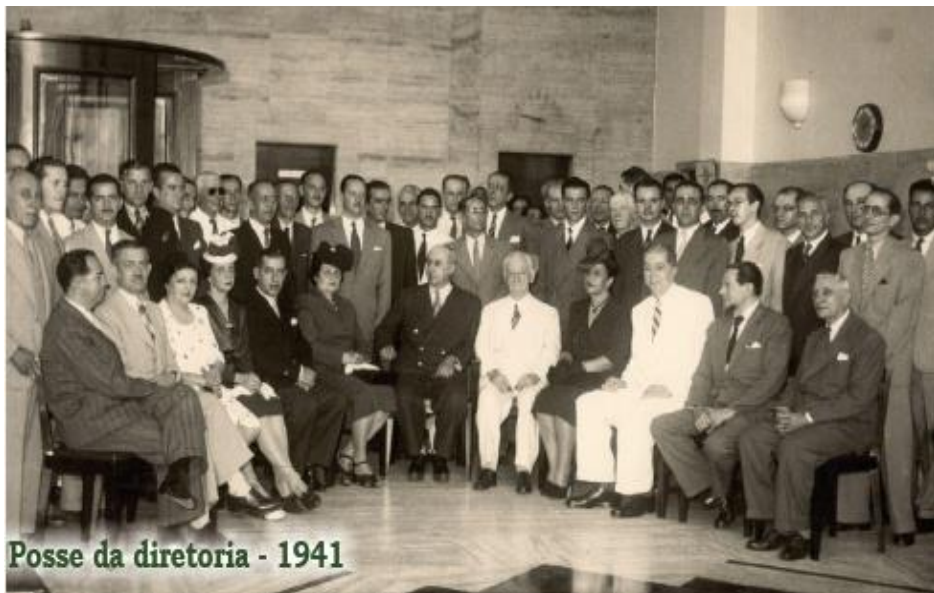
Posse da diretoria - 1941