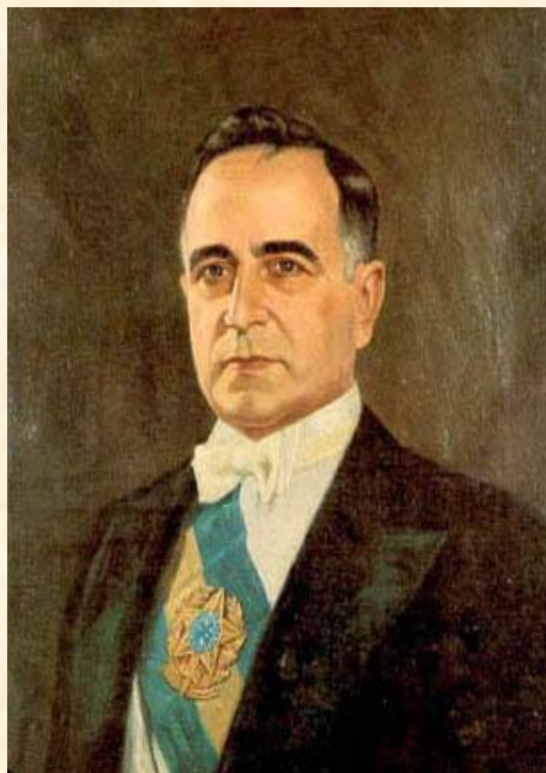
DOUTOR GETÚLIO DORNELLES VARGAS