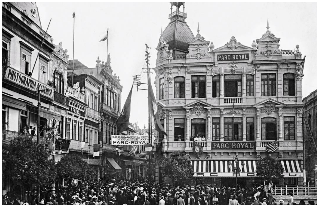
EDIFÍCIO PARC ROYAL – RIO DE JANEIRO